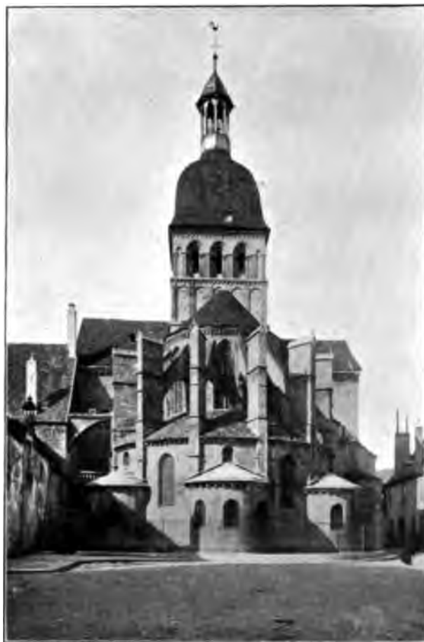
Abside de Notre-Dame